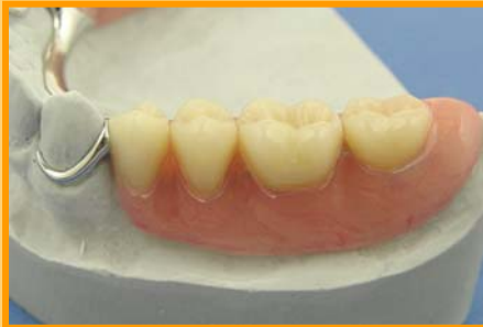
(Prothese mit Klammern)