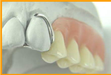
(Prothese mit Klammern)